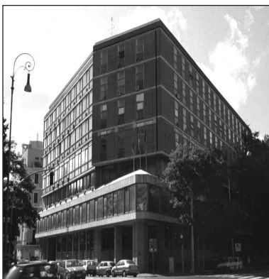
Roma, una sede dell'Inpdap

A partire dal mese di marzo i pensionati INPS, INPDAP ecc. riceveranno dall'Istituto una lettera che richiede di compilare e sottoscrivere il modello RED.